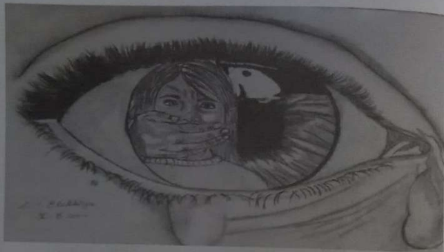
S.YELAKKIYA II B.COM